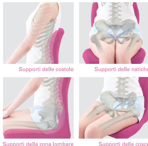
Supporti delle costole