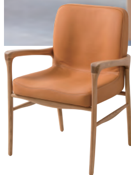
Quercia - Camel