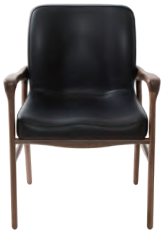
Noce - Nero